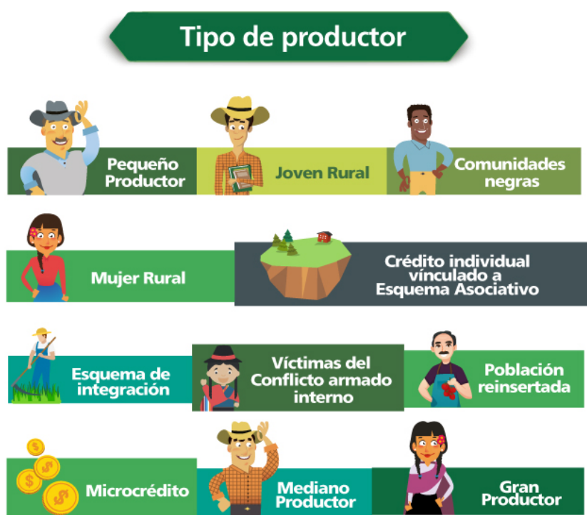
Ilustración 1. Clasificación Tipo de productor - FINAGRO