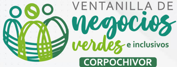
Imagen de la Ventanilla de Negocios Verdes