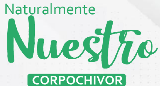
Imagen de la estrategia de marketing

Imagen de la Ventanilla de Negocios Verdes