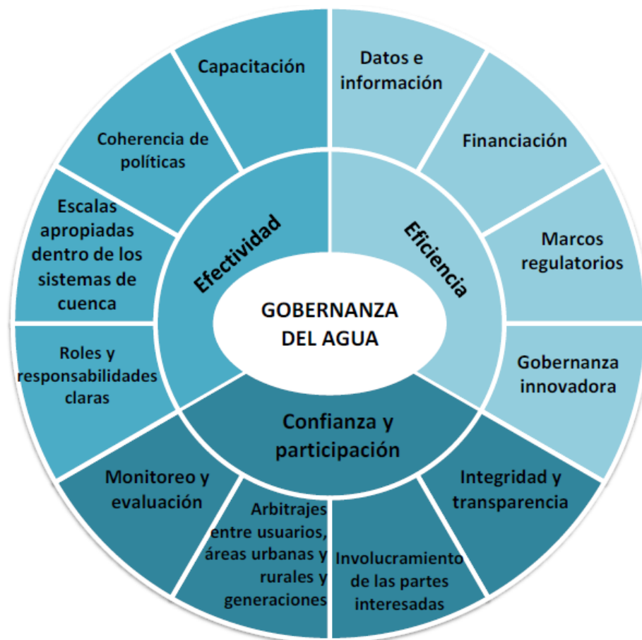
Visión general de los principios de la gobernanza del agua de la OCDE (OCDE, 2015)